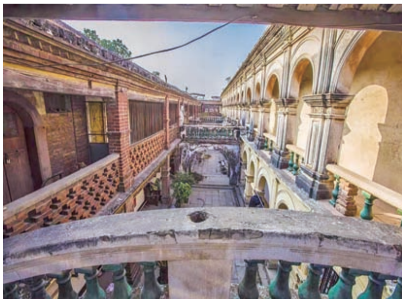
▲番仔樓內所有房間由廊橋相連，雨天走過全莊也不會淋到雨。

曾振源堅守傳統美德，又吸取異域文明，這也體現在他建造的大厝上，曾氏大厝就是中西合璧的典型。其實，角美鎮乃至整個漳州的許多“番客厝”都有這種既中又西、中西一體的特點，祇不過是曾氏大厝把這一特點發揮到了極致。（許初鳴）